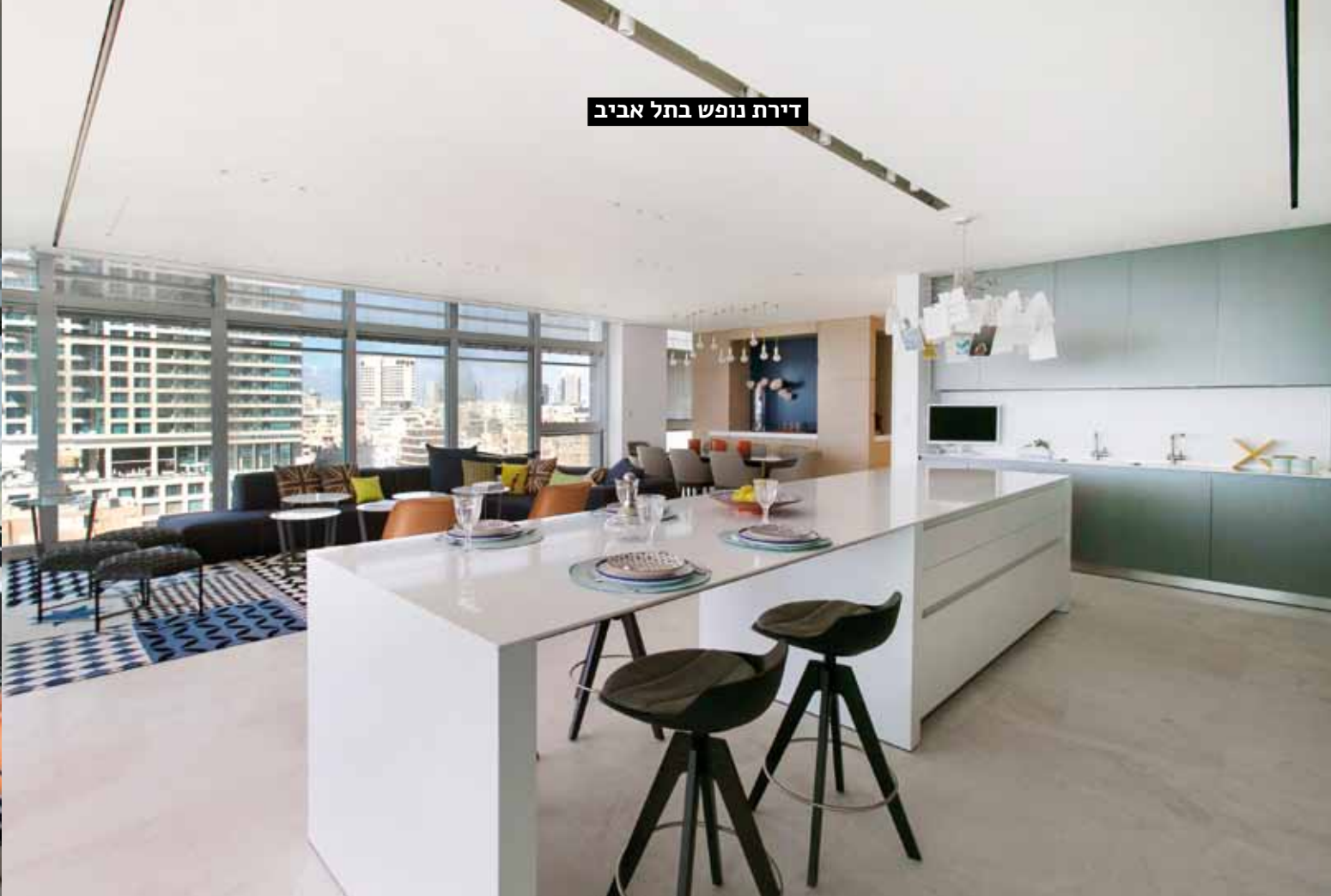
דירת נופש בתל אביב